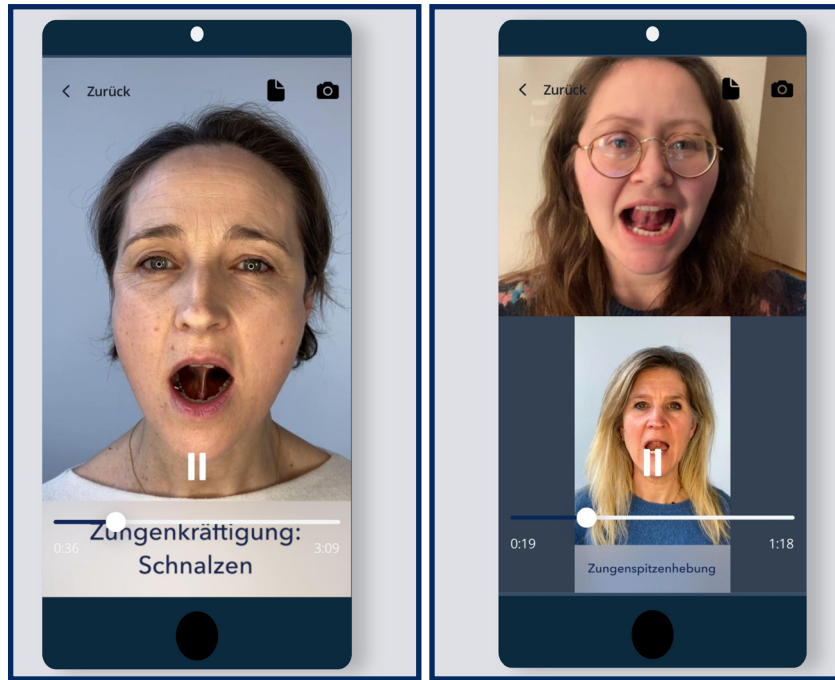
Übungsvideo für eine restituierende Übung (links); Durchführung einer Übung mit eingeschalteter Selfiekamera zur Selbstkontrolle der eigenen Ausführung (rechts)

Für Therapeut:innen stehen praxisnahe Hinweise zur Therapiegestaltung zur Verfügung.